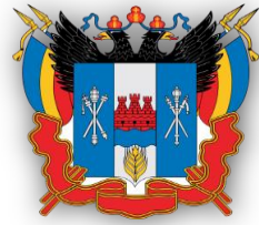
Общественная палата РО