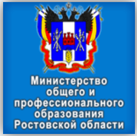
Министерство общего и профессионального образования Ростовской области